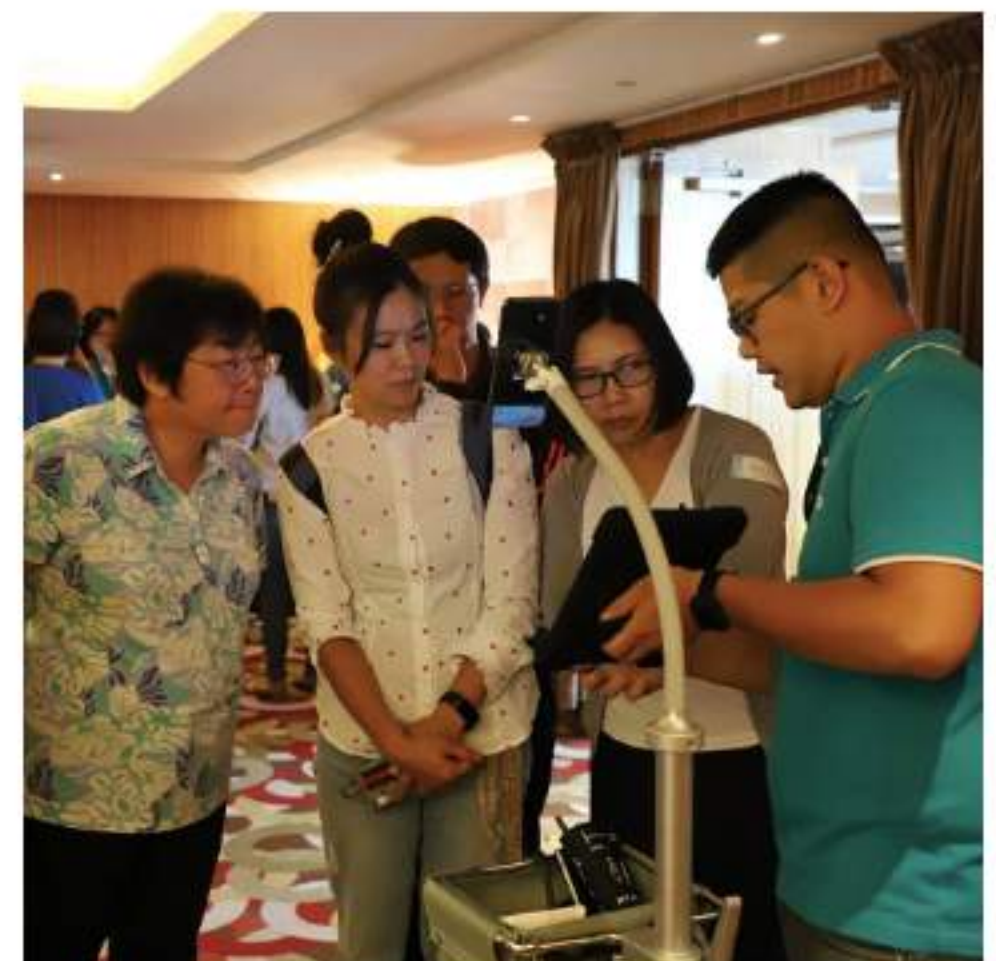
智慧醫療系統示範

「Apple 的 iPad 向來給人高品質的信賴感，」簡安里特助笑談間充滿讚許，「入住護理之家的長者家屬來探望時，看到我們使用 iPad，都會讚嘆佳醫護理之家是如此先進，深信自家長輩在這裡能夠得到優質照顧服務。」iPad 還可以幫助照服員識別長者身份。如醫院在量測病患生理數據時得先掃描病患手環上的識別條碼來確認病患身份，而佳醫護理之家則利用 iPad 配備的高畫質相機，為被照護的長者拍下清晰的照片，直接存入護理資訊系統。當護理工作人員進行量測要點選名單時，便依細膩銳利的螢幕所顯示的照片來比對長者身份，有助於工作效率及資料正確性。